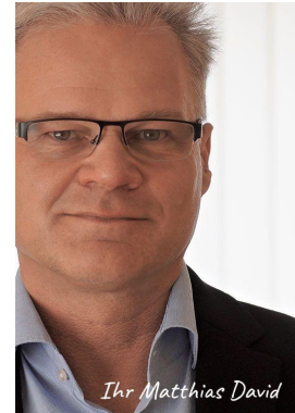
Ihr Matthias David

Unser B2B-Shop wurde vollständig überarbeitet und ist nun online. Die Einführung begleiten wir mit einem Gewinnspiel. Auf einer Seite hat sich unser kleiner "Firmenhund" versteckt. Finden Sie diesen und senden Sie uns einen Screenshot per E-Mail (info@david-comm.de / Betreff: Gewinnspiel). Sie gewinnen mit ein wenig Glück einen von 10 tollen Preisen.* Viel Spaß beim Stöbern und Suchen!